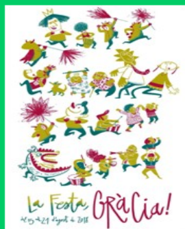
Cartell Festa Major 2018

FLAMA DEL CANIGÓ.- A títol informatiu i per si voleu assistir, us volem comunicar que des de fa tres anys la nostra associació recollim la flama del Canigó a la Pl. De la Vila i la tenim encesa tota la nit mentre celebrem la nostra revetlla. Enguany l'acta de rebuda de la flama a Gràcia serà als Jardinets a les 19 h. També hi haurà venda de fanalets i cap a les 19,30 h. començarà una cercavila fins la Pl, de la Vila on hi haurà una tarima i un peveter. Es llegirà un manifest per un representant de Fundació de Festa Major i allà es farà el repartiment del foc entre les diverses entitats que vulguin, per portar-lo a les seves respectives entitats o carrers.