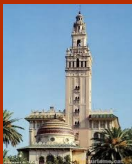
La Giralda de l'Arboç