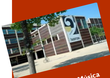
Museu de la Música

TROBADES GUARNIMENT FESTA MAJOR. — En aquestes dates ja hem de començar a pensar en el guarniment de Festa Major i per això tornem a fer com l'any passat de trobar-nos, en principi, els primers diumenges de mes al local de Milà i Fontanals, 4 . El primer diumenge de trobada és el dia 6 de febrer i coincideix amb el que hem indicat abans per preparar la disfressa de Carnestoltes; així al mateix temps que treballem per Carnestoltes podem anar coneixent els inicis del guarniment de Festa Major.