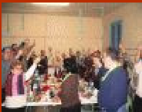
Cap d'any 2008