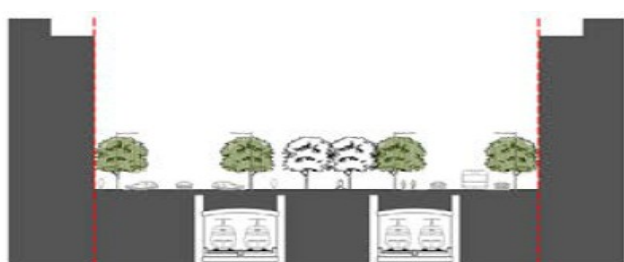
ESTAT ACTUAL SECCIÓ TRANSVERSAL

- 6 de juliol - a les 7 - al nostre local