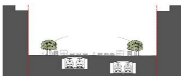
ESTAT ACTUAL SECCIÓ TRANSVERSAL